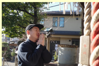
はつもうて なに 初詣、みなさんは何をおねがいしましたか?