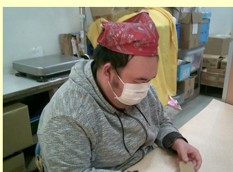
しごと しゅうちゆう とく お仕事は、集中して取り組みます!