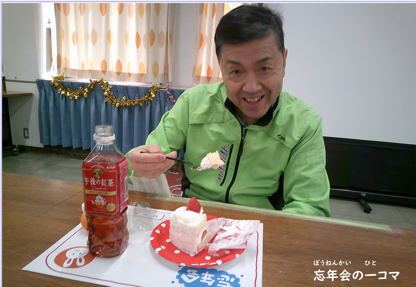
ぼうねんかい ひと 忘年会の一コマ