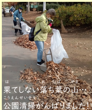
は ちん ちん ちん 果てしない落ち葉の山... こうえんせいそく 公園清掃がんばりました!