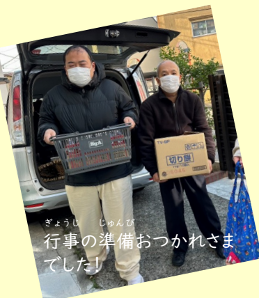
ぎょうし じゅんび 行事の準備おつかれさ ました!