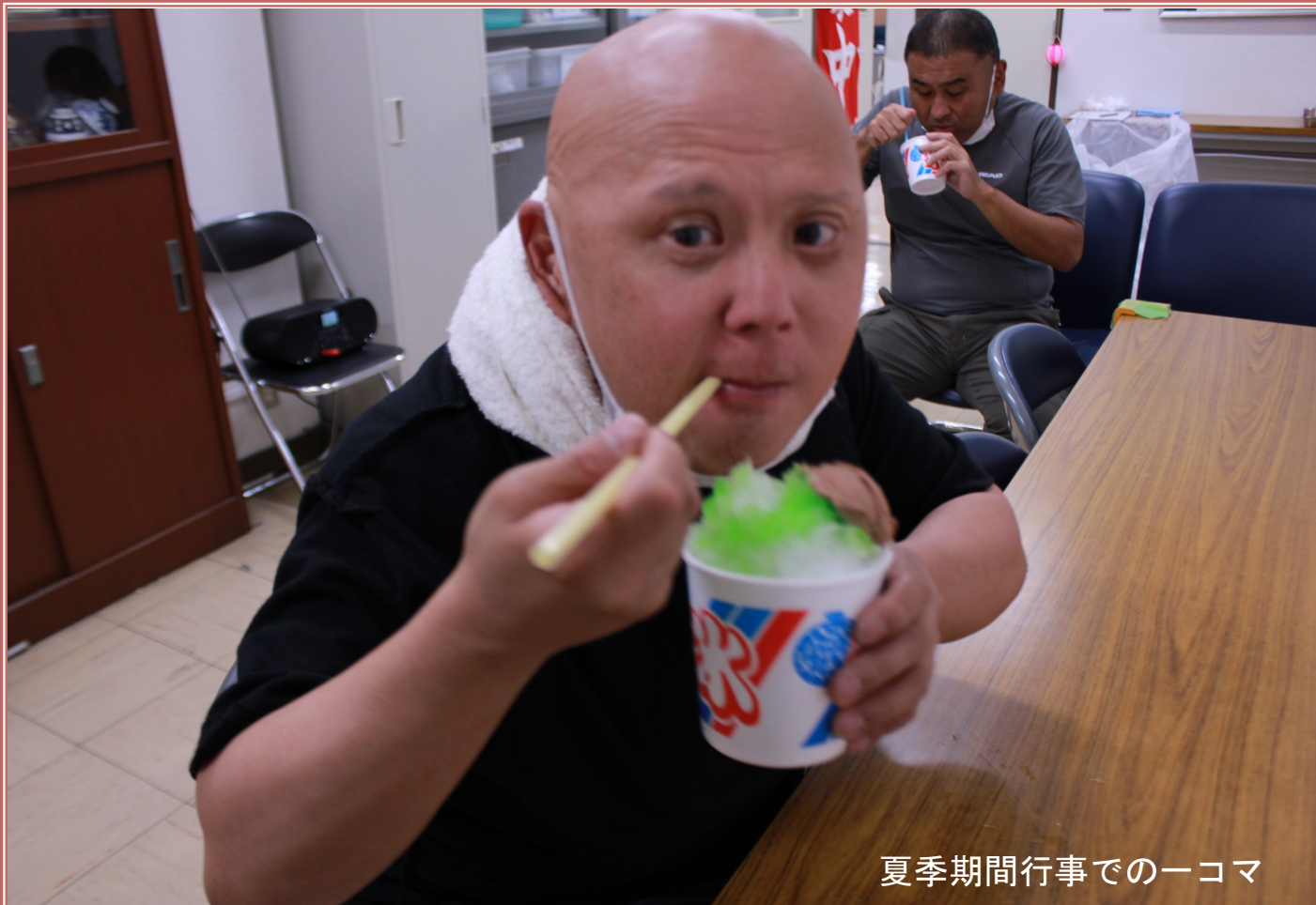
夏季期間行事での一コマ