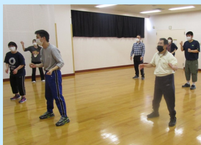
すぼーつくらぶ スポーツクラブ

6月からは新メンバーで活動スタート!利用者さんのきね川での生活が充実するような活動となればと考えています。