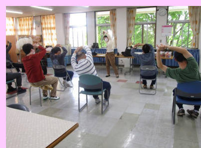
おんがくくらぶ 音楽クラブ