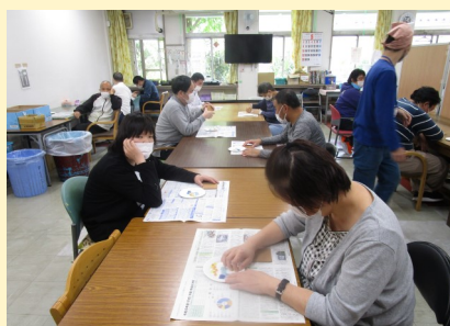
そうさくくらぶ 創作クラブ