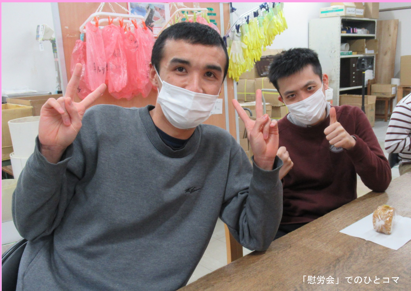
「慰労会」でのひとコマ