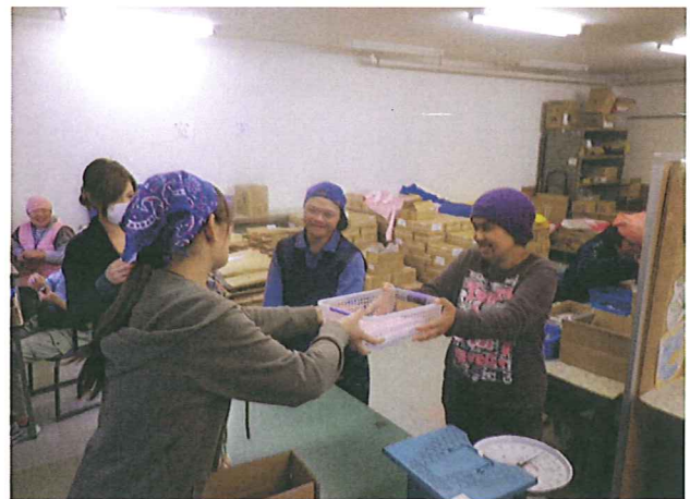
(右上) 完成したしおりを手渡す場面